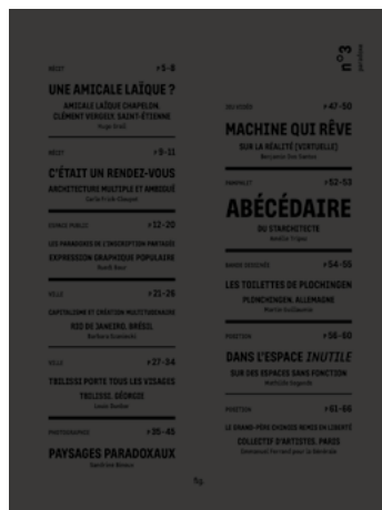
fig. n°3 paradoxe - octobre 2016

format : 190 x 255 mm nombre de pages : 156 nombre d'exemplaires : 500 prix : 16 euros