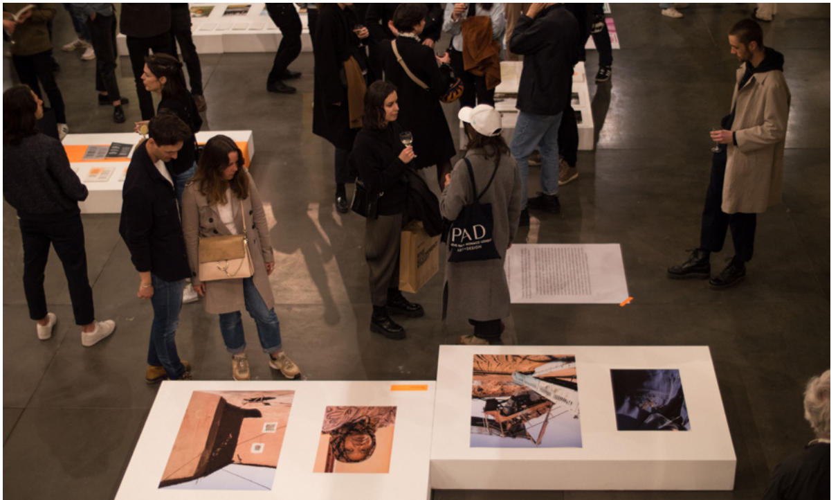
Lancement fig. n°7 au Pavillon de l'Arsenal, Paris - 2022