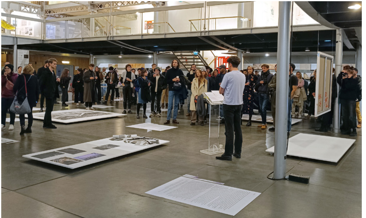
Lancement fig. n°8 au Pavillon de l'Arsenal, Paris - 2023