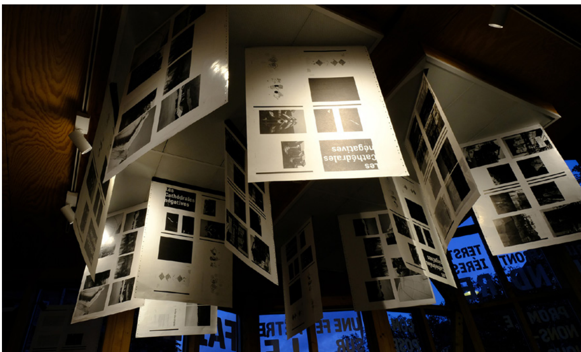
Lancement fig. n°6 au Paris Art Lab, Paris - 2020