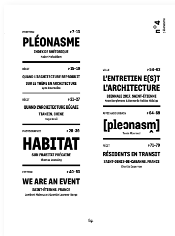
fig. n°4 pléonasma - avril 2018

La diversité des voix qui s'élèvent dans ce quatrième numéro de fig. montre quelques possibilités de concevoir d'autres architectures et d'entendre d'autres récits construits loin des logiques immobilières douteuses. Roland Barthes nous dit : « Je ne sais si, comme dit le proverbe, les choses répétées plaisent, mais je crois que du moins elles signifient ». À l'intérieur de ce numéro consacré au pléonasma, les choses répétées prennent sens dans les messages politiques de Tania Mouraud, dans les habitats précaires dissimulés aux interstices des villes, dans les immeubles type copier/coller des banlieues chinoises où l'on (re)copie également le style architectural occidental, dans l'entretien des rues ou dans l'invention de villes et mondes imaginaires. Elles signifient aussi dans les tentatives répétées de franchissement des frontières, de reconversion de lieux oubliés ou des messages de Délivrance (John Boorman). C'est un numéro qui redit la poésie de la figure pléonastique, faite de détours et d'aller-retours.